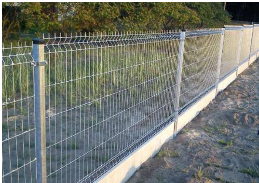
Panel ogrodzeniowy 2W - kolor GRAFITOWY RAL 7024