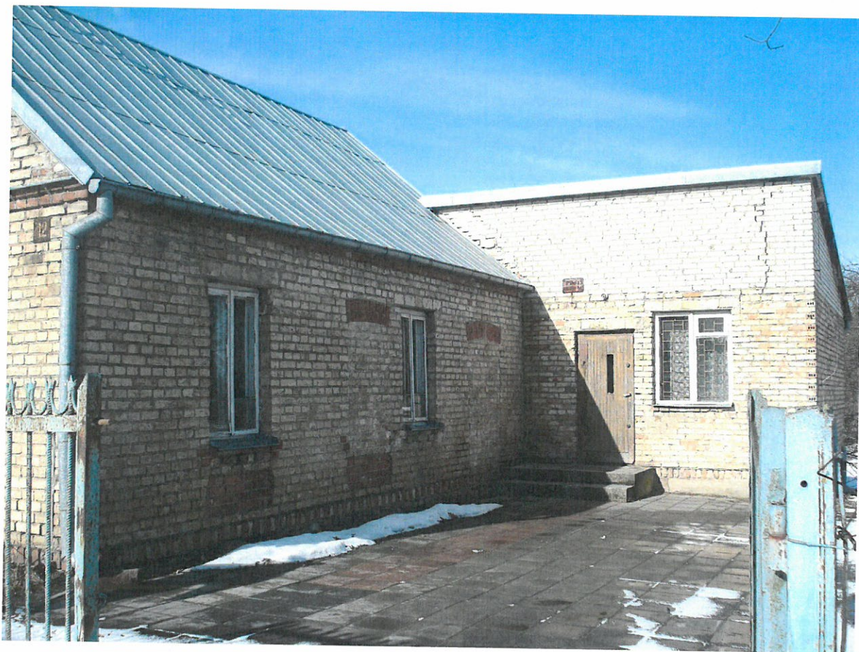
Budynek starej świetlicy wiejskiej znajdującej się w centralnej części miejscowości Barszczówka

Obszarem o szczególnym znaczeniu dla zaspokajania potrzeb mieszkańców miejscowości Barszczówka jest teren zlokalizowany w części centralnej miejscowości. Tutaj znajduje się najważniejszy obiekt w miejscowości – stara świetlica wiejska. Placyk przed świetlicą wiejską jest miejscem systematycznych spotkań mieszkańców wsi.