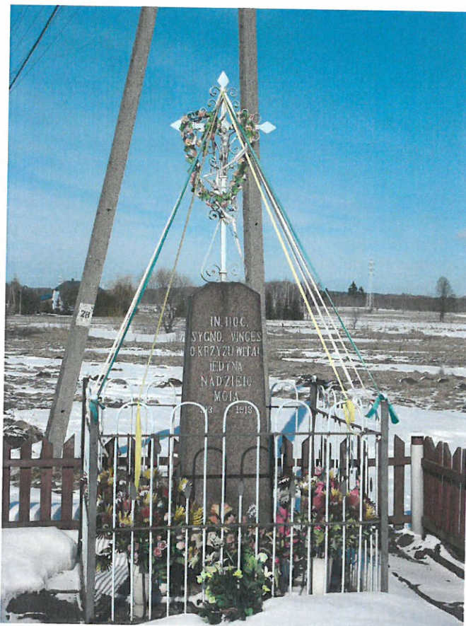
Rysunek 1 Krzyż przydrożny.

Początki miejscowości wzmiankowane są od roku 1528, w roku 1723 wieś liczyła 52 mieszkańców i należała do dworu Kotuńskiego w Czaplinie. Jedynym obiektem zabytkowym wsi Barszczówka jest krzyż, znajdujący się przy wjeździe do wsi, postawiony w 1913 roku.